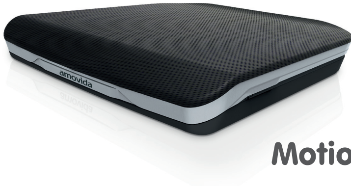
Motion Synergy (AV300)